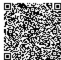
大阪府行政オンラインシステム （制度・提出書類なども記載）